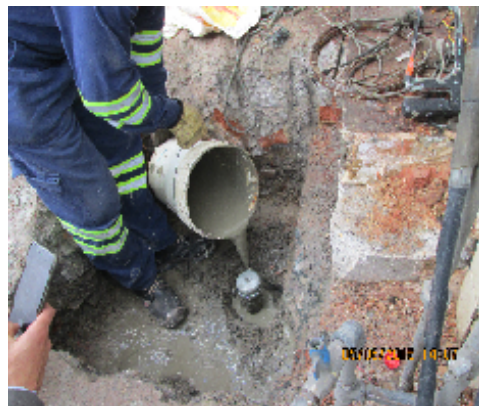
Foto No. 9. Vista de la aplicación de bentonita fluida sobre el espacio intergranular, de la boca del pozo.