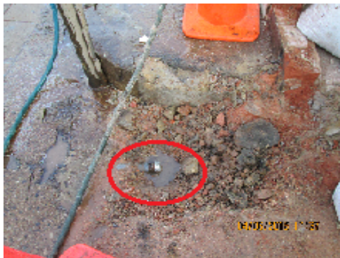
Foto No. 6. Vista del extremo de la tubería de producción, sellado con tapón roscado, que quedó enterrado bajo el piso de la zona de lavado de vehículos.