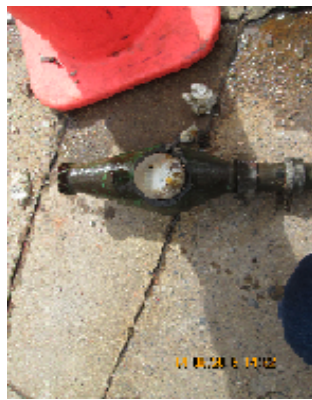
Foto No. 4. Vista general del medidor, desinstalado.