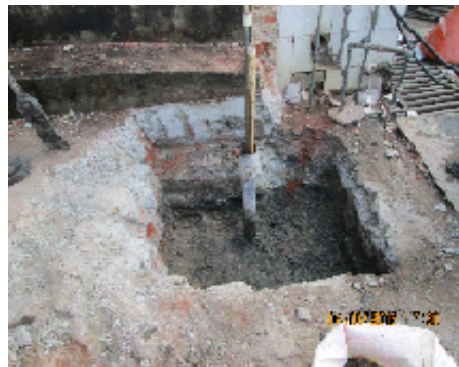
Foto No. 7. Vista de la caja perforada para la cimentación del sello sanitario.