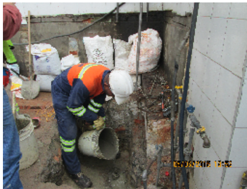
Foto No. 8. Vista del llenado de las tuberías con mezcla de bentonita y cemento gris.