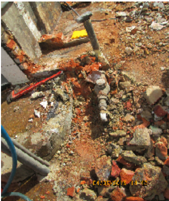
Foto No. 3. Vista del sitio donde se localizaba el medidor.