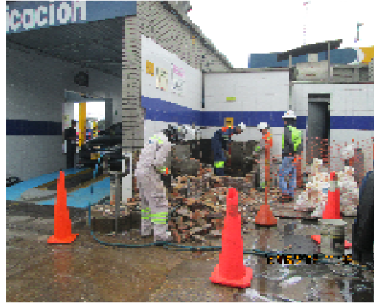
Foto No. 2. Vista del área donde se localiza la boca del pozo identificado con código pz-09-0034. Se observan las actividades de demolición de tanques de almacenamiento y tratamiento de agua que provenía del pozo.