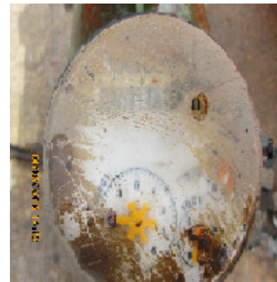
Foto No. 5. Vista del tablero del medidor, mostrando una lectura de 186 m 3 .