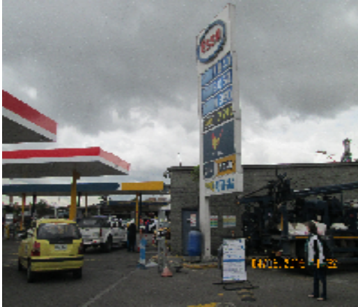
Foto No. 1. Vista frontal del predio correspondiente a la nomenclatura Calle 22C No. 68D - 20.